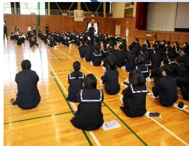
部活動紹介の様子↓